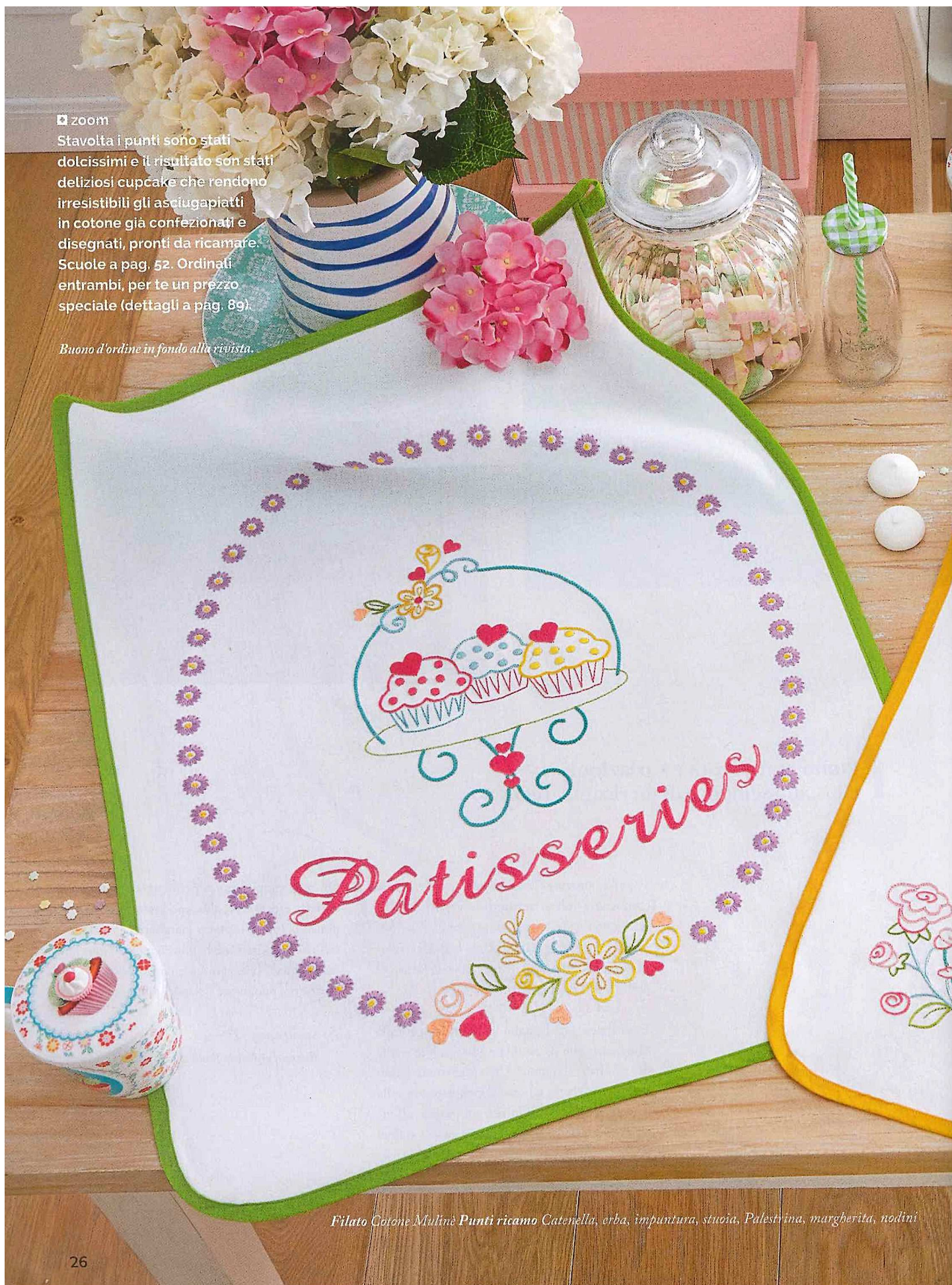
Filato Cotone Mullinè Punti ricamo Catenella, erba, impuntura, stuoia, Palestina, margherita, nodini